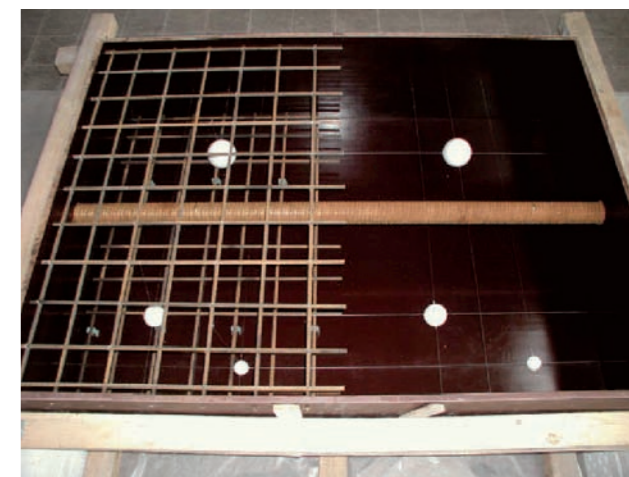
Vor dem Betonieren aufgenommenes „Innenleben“ des Stahlbetonbauteils mit Hüllrohr und Fehlstellen

SAFT-Algorithmus (Synthetic Aperture Focusing Technique) rekonstruiert. Die Spannglieder können in einem zweiten Messdurchgang koordinatengenau mit dem Scanner angefahren und hinsichtlich ihres Verpresszustandes mit Ultraschallecho untersucht werden. Die Ergebnisse werden nach räumlicher Rekonstruktion vor Ort angezeigt. Daraus lässt sich die Konstruktion (z. B. Anzahl, Tiefenlage und der genaue Verlauf der Spannglieder) ableiten. Dies ist notwendig, falls Ungewissheit über die Ausführung besteht bzw. keine Bestandspläne für einzelne Bauwerksteile vorliegen.