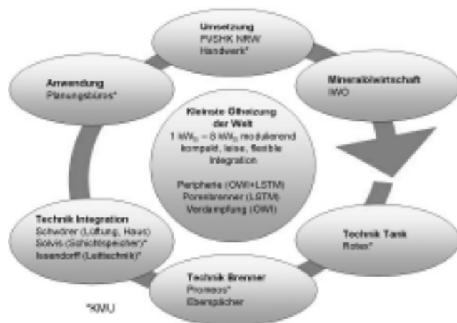
Abbildung 2: Netzwerkstruktur zum Projekt „Kleinste Ölheizung der Welt“

Das Projektkonsortium deckt die notwendigen Fachgebiete aus Forschung, Industrie und Handwerk zur Umsetzung eines innovativen Heizkonzeptes in vertikaler Weise ab. Hierbei werden die Forschungseinrichtungen Oel-Wärme-Institut (OWI) und der Lehrstuhl für Strömungsmechanik der Universität Erlangen (LSTM) durch die anwendungsnahen Forschungsbereiche der beteiligten Industriefirmen Eberspächer, Promeos, Solvis, Rotex, Issendorff und Schwörer ergänzt, so dass eine Fertigung von marktnahen Prototypen und eine produktorientierte Entwicklung möglich werden. Der Praxisbezug für eine spätere Umsetzung wird durch die Beteiligung des Handwerks (Hamacher, Volkert) sichergestellt. Die Forschungsaktivitäten werden durch die Interessenverbände Institut für wirtschaftliche Ölheizung (IWO) und den Fachverband Sanitär Klima Heizung NRW begleitet, die für eine ausreichende Verbreitung und Klärung der Rahmenbedingungen für die Markteinführung der Entwicklung sorgen. Die genannten Teilbereiche der Entwicklung einer Hausenergiezentrale und ihre Vernetzung sind in Abbildung 2 dargestellt.